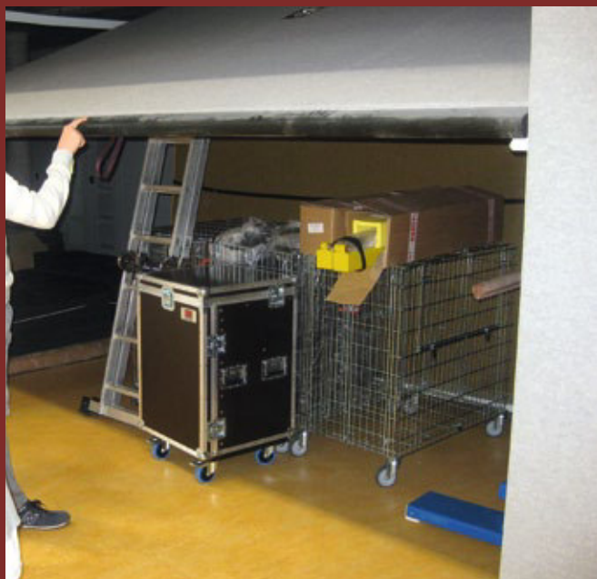
Hier wird gerade eine Sicht- und Funktionskontrolle durchgeführt.

Der Betreiber hat die Verantwortung, eine Gefährdungsbeurteilung für die Geräteraumtore zu erstellen. In dieser Gefährdungsbeurteilung werden anhand technischer Prüfstandards/ Normen und insbesondere mit den Angaben der Betriebsanleitung des Herstellers der Umfang, die Qualifikation der Prüfer sowie die Prüfintervalle festgelegt.